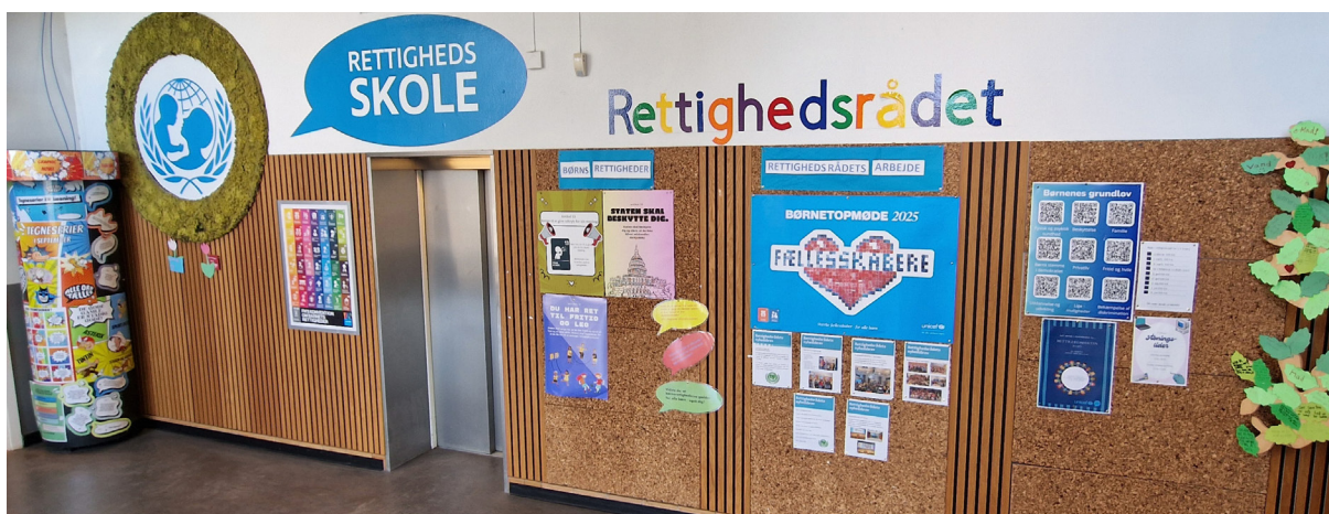
Rettighetsvegg på Hendriksholm Rettighetsskole i København.

Rettighetsveggen er elevrådets oppslagsvegg på en rettighetsbasert skole. Her kan resultatene fra undersøkelsene og annen informasjon fra elevrådet offentliggjøres, elevrådsmedlemmene presenteres, periodens rettighet og plakat med barnerettighetene henge. Ved rettighetsveggen kan dere også ha en «elevrådspostkasse» der forslag til saker til elevrådet kan legges.