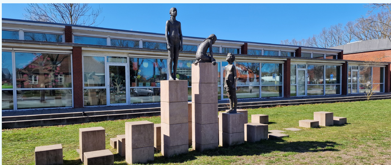
«Venskabstrappen» av kunstneren Malene Bjerke står utenfor Hendriksholm Rettighetsskole i København. Hver av steinsoklene representerer en artikkel i FNs barnekonvensjon. De brukes av barna til å stå, kravle og sitte på, og symboliserer på den måten hvordan barnekonvensjonen er det solide fundamentet for en trygg barndom.

Her er en kortfattet oversikt over hva som definerer UNICEFs skolenettverk inkludert årshjul for elevrådets rettighetsarbeid. Like viktig er imidlertid at FNs barnekonvensjon får være en tydelig, felles referanseramme som preger voksne og barn og hele skolens virksomhet. UNICEFs Læringsunivers har ressurser som hjelper skolene med å implementere dette i den ordinære virksomheten.