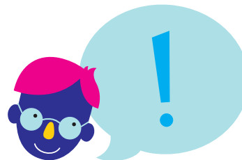
Si sin mening