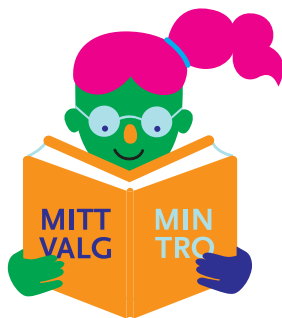
Praktisere sin kultur, tro og språk