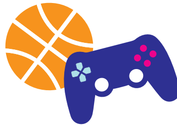
Fritid og lek