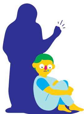
Beskyttelse mot misbruk