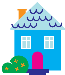
Et sted å bo