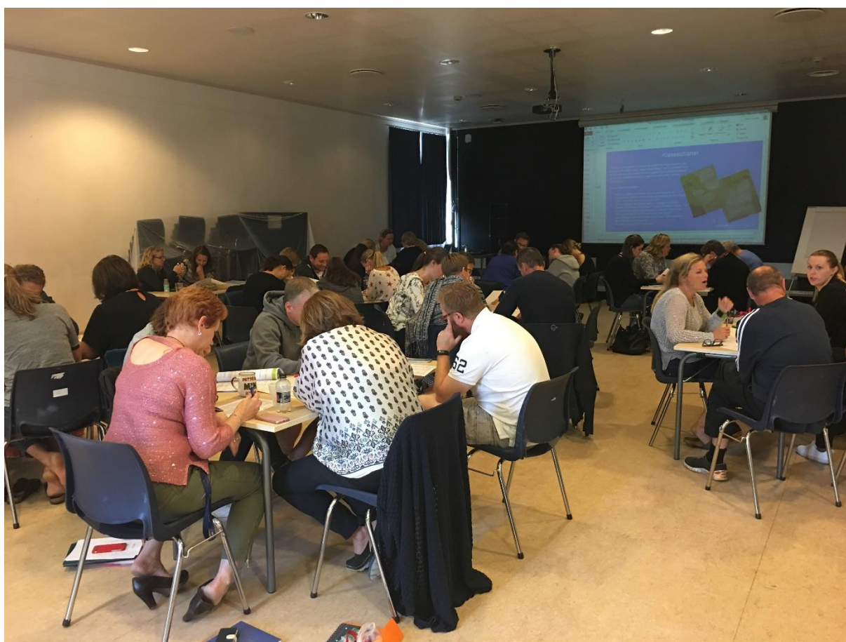
Teamarbeid på Sten-Tærud skole